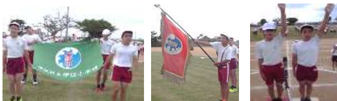
校章旗を掲げて堂々の入場です。 誓いの言葉

どの学年も元気いっぱい演技を披露します。御期待下さい! 各学年の演技を簡単に紹介します。